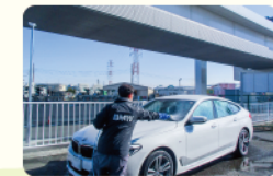
就労者の様子・洗車