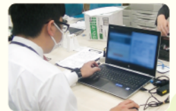
就労者の様子・事務補助